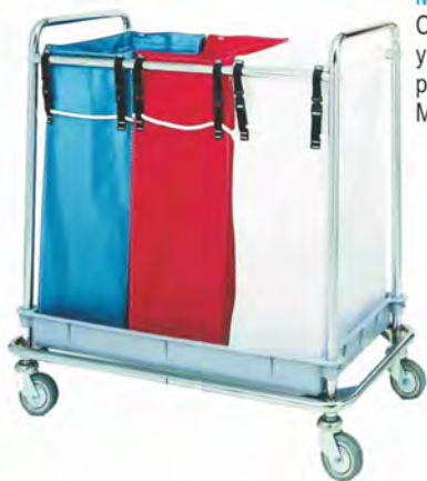
Mod. 110/3 Con chasis cromado o inox y 3 bolsas de polipropileno plastificadas. Medidas: 95x56x104 cm