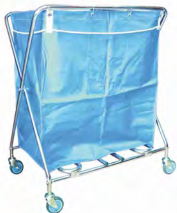
Mod. 120 Chasis cromado con bolsa plastificada de 343 lts. Opción acero inox. Medidas: 90x62x108 cm