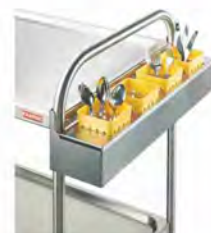
Soporte para cubiertos

Carros contruidos totalmente en acero inox. Estantes muy robustos de 500 mm y 0,8 mm de espesor. Posibilidad de 2, 3 y 4 estantes. Carga por estante de 65 kg, hasta un total de 180 kg. Medidas: Consultar