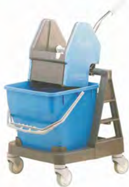
Equipo Sani Duo Material: Polipropileno Capacidad: 18 l. Medidas: 40x40x85cm