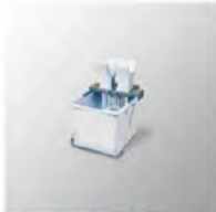
Kit de 15 lts