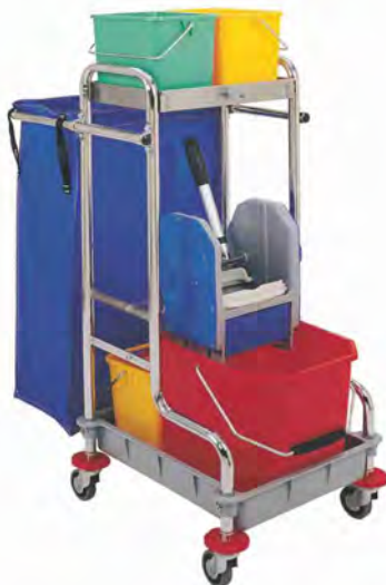
Mod. 570 Acero inoxidable 18/8, cubo de 25 lts con prensa y 2 cubos de 6 lts, bolsa plastificada y asa telescópica. Capacidad bolsa: 77 Lts. Medidas: 82x48x109cm