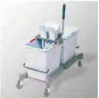
Kit doble de 25 lts