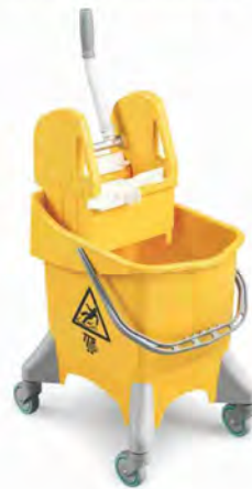
Equipo TEC Material: Polipropileno Capacidad: 30 l. Medidas: 49x40x63 cm