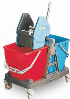
Equipo Sani Duo Doble Material: Polipropileno Capacidad: 2 x 18 l. Medidas: 66x40x85cm

Accesorios: mango y cestillo opcionales.