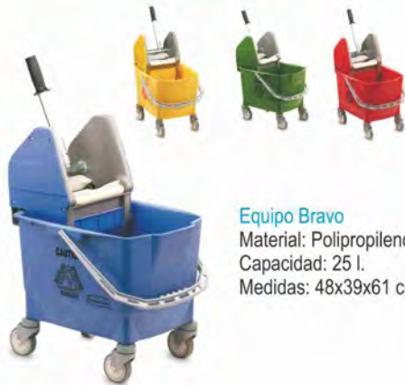
Equipo Bravo Material: Polipropileno Capacidad: 25 l. Medidas: 48x39x61 cm