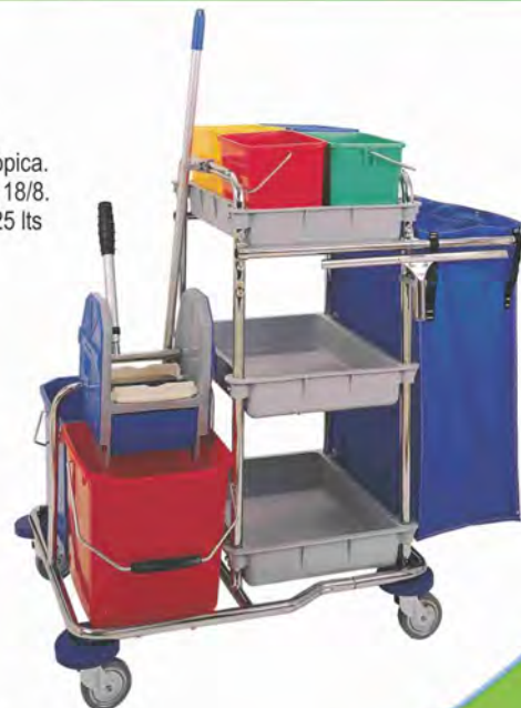
Mod. 560 3 Bandejas de polipropileno, color gris, chasis cromado, bolsa plastificada y asa telescópica. Se fabrica en acero inoxidable 18/8. 4 cubos de 6 lts y 2 cubos de 25 lts con prensa. Capacidad bolsa: 77 Lts. Medidas: 108x70x104 cm