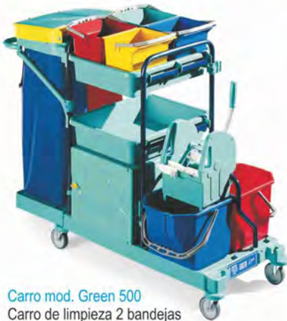
Carro mod. Green 500 Carro de limpieza 2 bandejas con bolsa y box Material: Polipropileno Medidas: 138x65x107cm