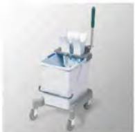
Kit de 25 lts