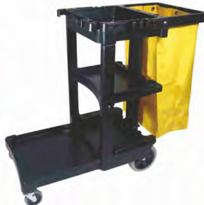
Carro mod. 6173 Carro de limpieza con bolsa de vinilo con cremallera. Material: Polipropileno Medidas: 117x55x98cm