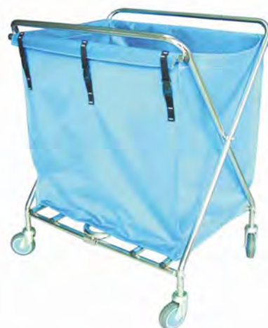
Mod. 230 Chasis cromado con bolsa plastificada de 195 lts. Opción acero inox. Medidas: 76x56x92 cm