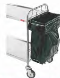
Soporte para bolsas