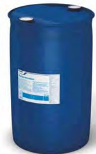
Turbo Emulsión 200 kg.