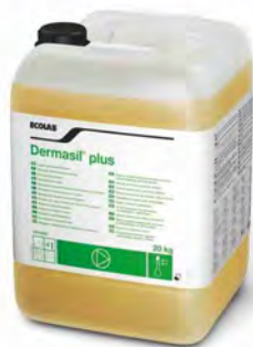
Dermasil Plus 20 kg.