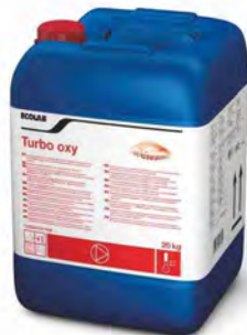
Turbo Oxy 20 kg.