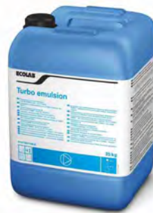
Turbo Emulsión 25 kg.