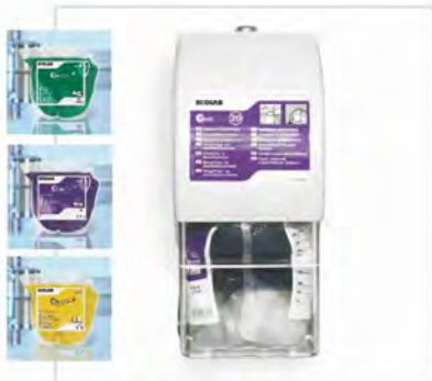
Soporte para bolsa de 2 l.