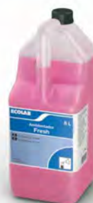
Caja 4u x 5 l.