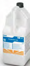
Conductive Star Recubrimiento para pavimentos conductores, indicado para uso industrial y hospitalario.