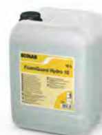
FoamGuard Hydro 10 Aguas duras Bidón 10 l