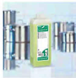
Floorguard 30 Limpiador de suelos