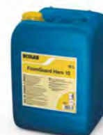
FoamGuard Hero 10 Higienizante clorado. Bidón 10 l