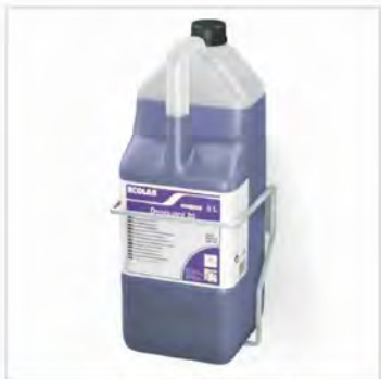
Soporte para garrafa