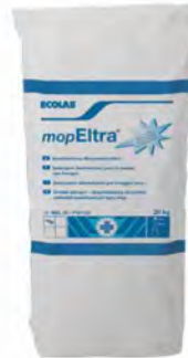
Mop Eltra Hygienic Detergente higienizante para mopas.