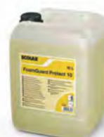
FoamGuard Protect 10 Especial materiales sensibles. Bidón 10 l