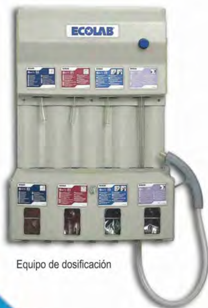
Equipo de dosificación