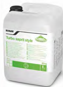
Turbo Saprit Style 20 kg.