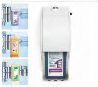
Soporte para botella de 1 l.

El Sistema Penguin 4U se utiliza para la dosificación exacta de hasta 4 productos, eliminando la necesidad de dosificar los productos manualmente o de tener un equipo dosificador para cada producto. Se puede utilizar con productos en botella de 1 l, bolsas de 2 lts o garrafas de 5 o 10 lts, eligiendo el soporte correspondiente. Sistema exacto, seguro y eficaz, que aporta unos resultados óptimos.