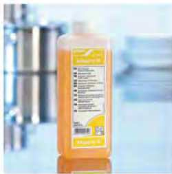
Allguard 10 Multiusos desengrasante