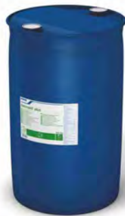
Dermasil Plus 200 kg.