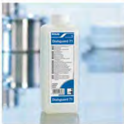
Dishguard 71 Lavavajillas manual