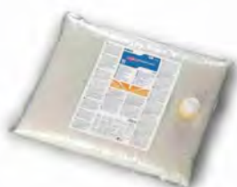
Phazer Isi Star Recubridor autobrillante de elevada duración.

La manera mas rápida y económica de recubrir pavimentos