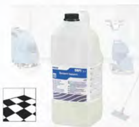
Benduroil Topquick Decapante de alto nivel.