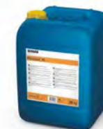
P3 Topax 99 Limpiador desinfectante. Bidón 20 kg