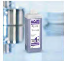
Desguard 20 Limpiador desinfectante

El Sistema Penguin para la limpieza de la cocina, se basa en una gama de productos altamente concentrados que cubren todas las necesidades de higiene y desinfección en cocina. Una gama de productos que se utiliza mediante los dosificadores Penguin, que nos ofrecen diferentes modelos, con y sin instalación a toma de agua, que tienen un manejo sencillo, seguro y exacto, que nos permite obtener la cantidad justa de producto para optimizar los resultados de limpieza, asegurando un control de costes.