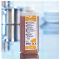
Floorguard Special 31 Renovador de suelos