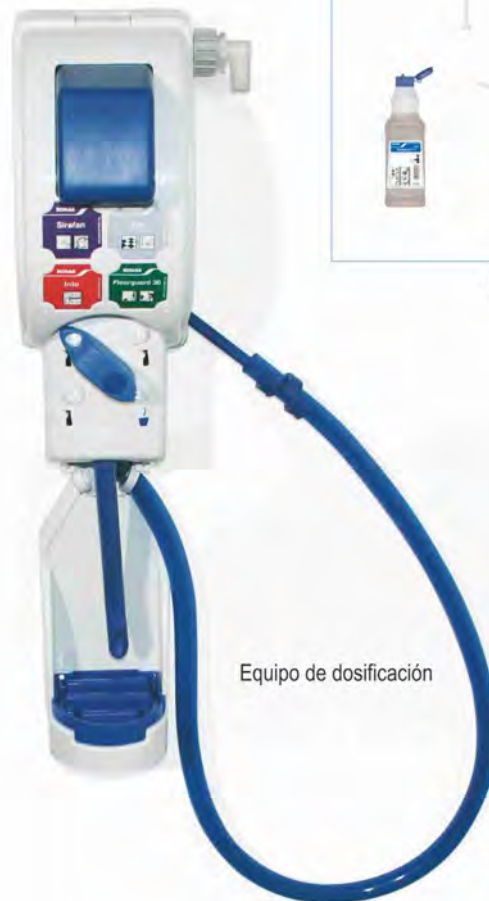
Equipo de dosificación