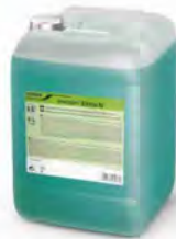
Incidin Extra N Desinfectante sin aldehídos Bidón 6 l.