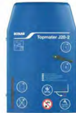
Dosificador Topmater J20