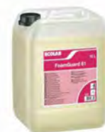
FoamGuard 61 Limpiador ácido. Bidón 10 l