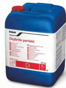
Oxybrite Perfekt 22 kg.